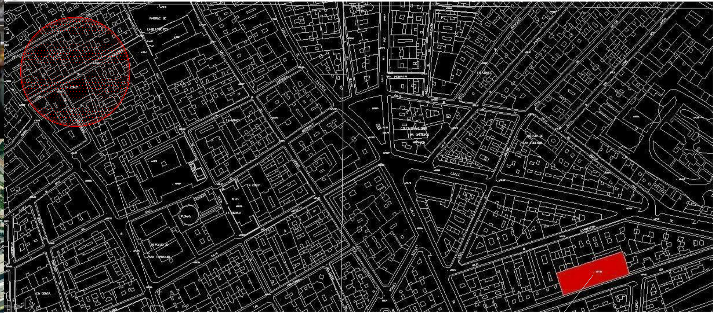
Plaza Cabestreros esquina Amparo

_La Plaza de Cascorro está especializada en la venta de ropa underground y accesorios más o menos góticos.