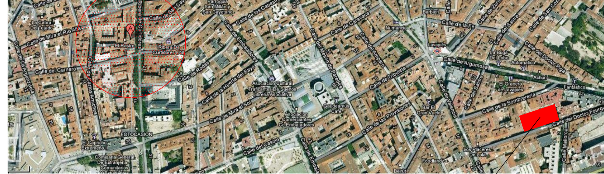
Ribera de curtidores